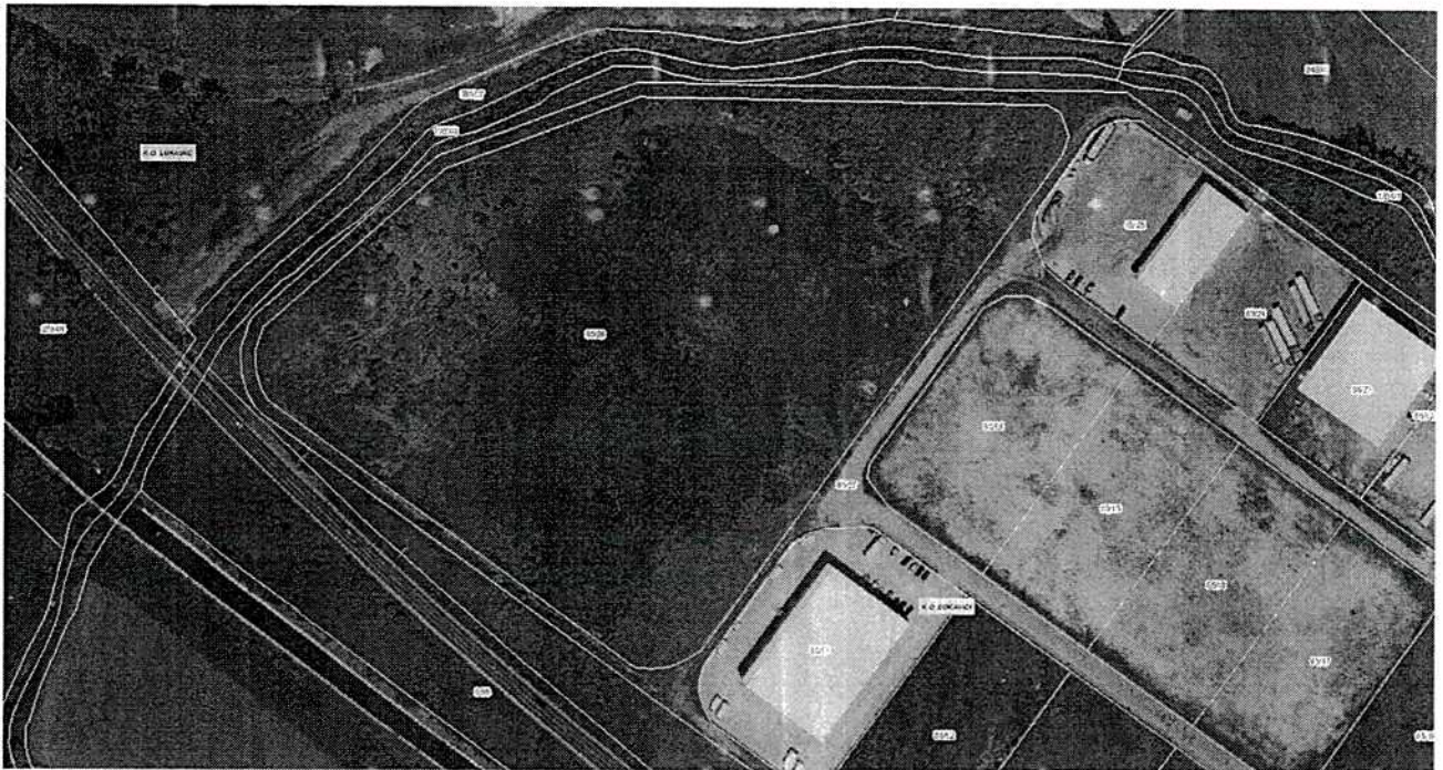
Slika 1. Prikaz lokacije na orto – foto snimku

Na osnovu zahtjeva investitora "Voith Hydro Bosnia" d.o.o. Živinice izrađen je plan parcelacije za potrebe izgradnje poslovnih objekata na parceli označenoj kao k.č.br. 65/26 KO Bokavići. Ova parcela je ranije tretirana u okviru obuhvata Regulacionog plana „Industrijska zona Lukavac“ iz 2007. godine kojim je definisano da je zbog veličine i oblika iste neophodno izraditi dodatnu plansku dokumentaciju. S tim u vezi je izrađen ovaj plan parcelacije kojim je definisana konačna namjena prostora sa jasno definisanim sadržajima i maksimalnim gabaritima objekata.