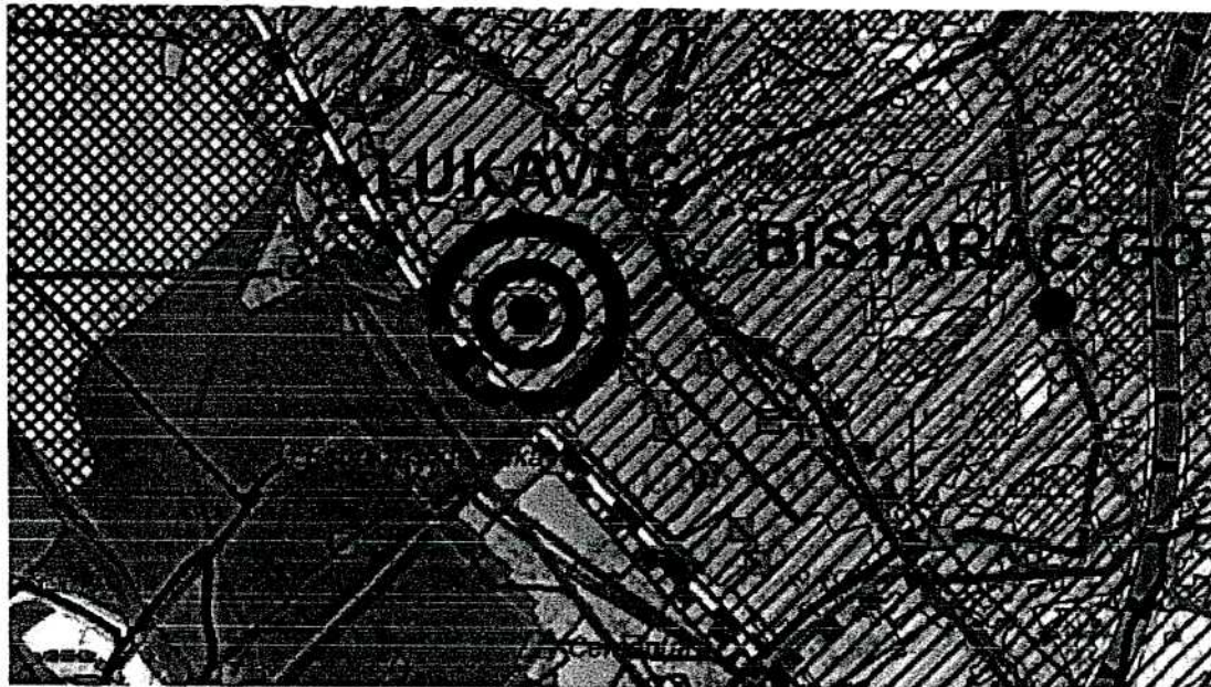
Slika 2. Izvod iz Prostornog plan općine Lukavac za period 2015–2035.godina

Ukupna površina parcela k.č. 2537/2 i 2537/5 KO Lukavac iznosi cca 3150m 2 , a parcele 2523/2 KO Lukavac 1048 m 2 pri čemu je urbanističko rješenje lokacije rađeno za kompletan kompleks naselja u vlasništvu Luciana d.o.o. Lukavac koji iznosi cca 11370 m 2 i za parcelu 2523/2 KO Lukavac. Obzirom da za urbano područje općinskog centra ne postoji važeći Urbanistički plan, planom višeg reda za predmetni obuhvat smatra se Prostorni plan općine Lukavac za period 2015-2035. godina („Službeni glasnik općine Lukavac“, broj 1a/16, 7/16 i 8/16) u daljnjem tekstu Prostorni plan . Ovo podrazumjeva, obavezno pridržavanje smjernica za prostorni razvoj koje su date u gore navedenom Prostornom Planu, a naročito opredjeljenja vezanih za saobraćaj, komunalnu infrastrukturu, namjenu korištenja zemljišta.